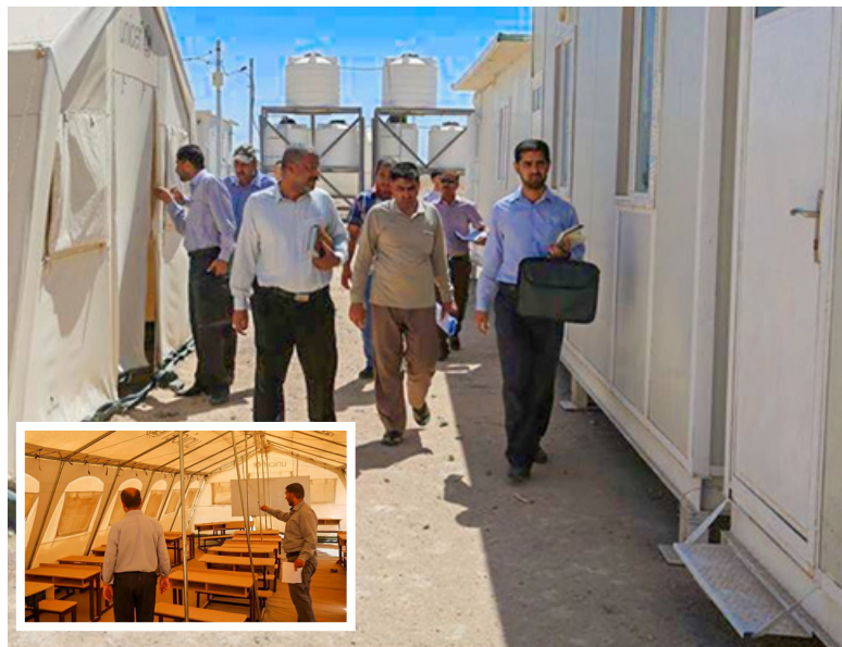
آلاف متر، مع الاستمرار في برنامج دعم الجانج الصحي لهم شهريا فضلا عن توزيع خزانات المياه الصالحة للشرب سعة (٥) الآلاف لتر على أكثر من ٩١ ألف نازح في المحافظة.

وأضاف قائلا: من ضمن أهم الخدمات المقدمة بناء وتأهيل عدد من المدارس لأطفال النازحين إضافة إلى بناء متنزه صغير مساحته (٣)