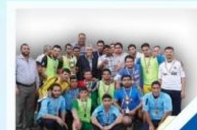
٣٥ بطولة خدمة الإمامين