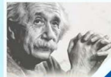
٢٢ معادلة الحياة والموت