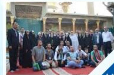
١٢ شباب عراقيون