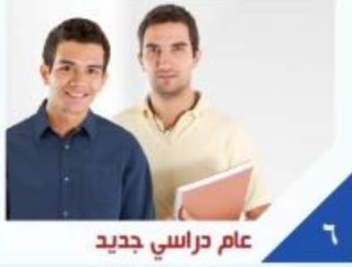
عام دراسي جديد