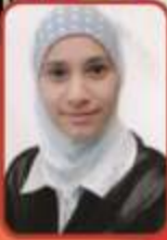
مشاركة الصديقة تبارك هيثم الصف الاول المتوسط