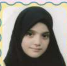
مثار اسعد صباح