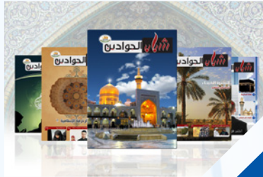
الشباب توعد شمعتها الثانية ٨