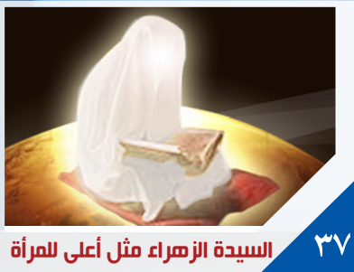
السيدة الزهراء مثل أعلى للمرأة ٣٧

مجلة شهرية فكرية ثقافية عامة تعنى بالشباب تصدر عن الشؤون الفكرية والثقافية في العتبة الكاظمة المقدسة العدد «١٣» السنة الثانية جمادى الثانية ١٤٣٤هـ نيسان ٢٠١٣م