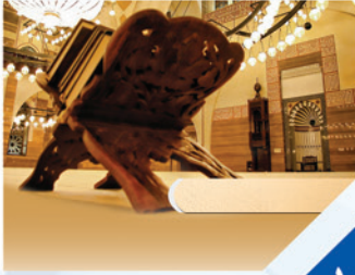
لقاء مع الطيب حامد زيدان