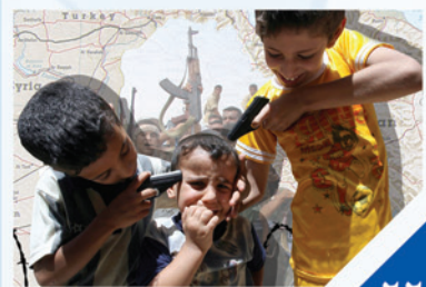
تأثير العنف التلفزيوني على الأطفال