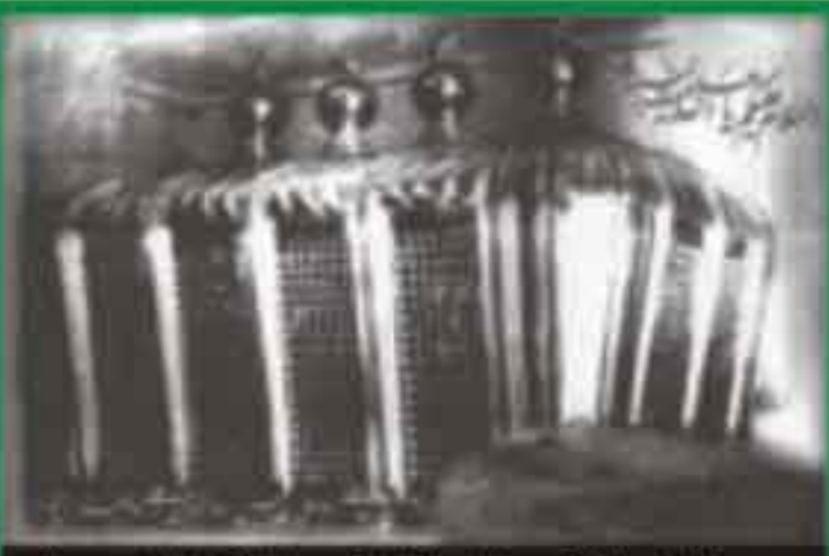
صورة نادرة لقبور ائمة البقيع قبل تهديمها

حرصت الامم المتمدنة على تخليد رموزها والحفاظ على