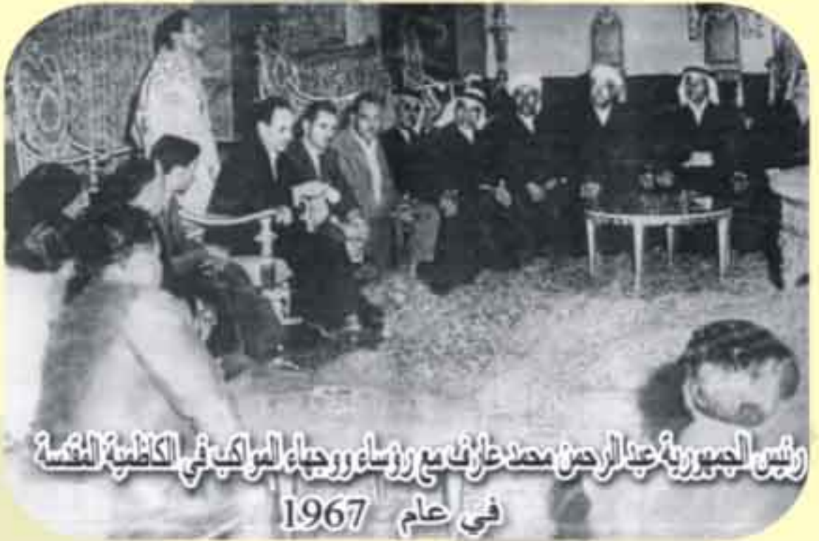
رئيس الجمهورية عبدالرحمن محمد عارف مع رؤساء ورجاء المواكب في الكاظمية المقدسة في عام 1967

ج - بعد زوال النظام البائد وفي أول ممارسة عفوية للشعائر الحسينية بعد إنقطاع لمدة تزيد على خمسة وثلاثين عاما خرجت المواكب في مدينة الكاظمية لتمارس حقها في التعبير بالمواساة وحزنها على الإمام الحسين (عليه السلام) ، ونتيجة